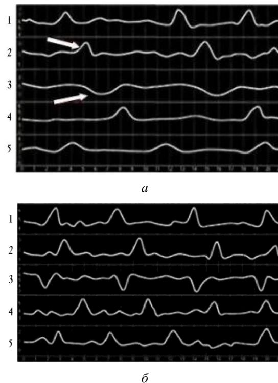
Рис. 2. Диаграмма перистальтики желудка и ДПК: а — гипокинезия на 7-е сут, снижение амплитуды сокращения (указаны стрелкой); б — на 30-е сут отмечается нормокинезия

В ранние сроки после операции регистрировались явления гипомоторной дискинезии желудка (гипокинезия). Снижение тонуса культи желудка в первые дни после операции имеет функциональный характер в результате операционной травмы и пересечения нервных сплетений. Регистрацию моторики желудка выполняли до операции у всех животных для сравнительного анализа полученных результатов в послеоперационном периоде. При исследовании моторики у всех животных отмечалась гипокинезия желудка, что характеризовалось снижением амплитуды сокращения и удлинением перистальтической волны (рис. 2,а). На 30-е сут у большинства животных наблюдалось восстановление моторики желудка, которая определялась в виде отчетливой регистрации кривой на диаграмме (рис. 2,б).