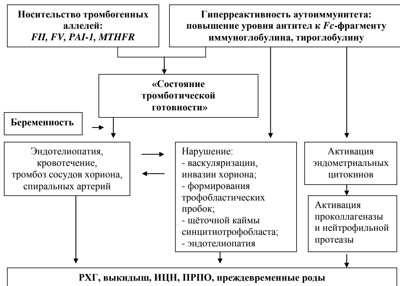
Рисунок 1 – Связь факторов тромбогенного риска и повышенной аутоиммунной реактивности с осложнениями течения беременности

Таким образом, изучаемые мутации генов свёртывающей системы крови и/или фолатного цикла в различных комбинациях с повышением уровня аутоантител у женщин с РХГ в первом триместре являются маркёрами и предикторами неблагоприятного течения и исхода беременности (рисунок 1).