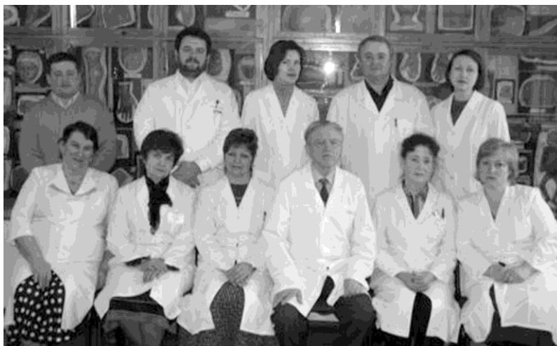
Коллектив кафедры дерматовенерологии и косметологии СибГМУ, 2011 г.

Дерматологическая клиника СибГМУ сыграла огромную роль не только как основная база для обучения студентов и подготовки квалифицированных кадров. Велико ее значение в оздоровлении населения. В дерматологической клинике ежегодно получают лечение более 900 больных различными дерматозами. Контингенты, страдающие наиболее тяжелыми кожными заболеваниями, как правило, поступают на эту базу кафедры.