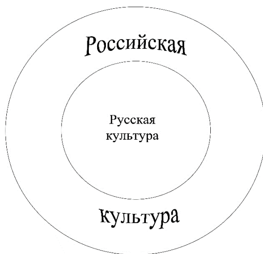
Рис. 2. Этноцентричная структура культуры.

Вместе с тем, культура каждого общества изнутри также имеет довольно сложную, многоуровневую и разноплановую структуру. С одной стороны, в любой культуре существует иерархия – есть элитарная культура, мидкультура и массовая культура, которые образуют вертикальный срез культурных уровней. С другой стороны, большая культура подразделяется на подгруппы, которые находятся в неиерархических отношениях между собой и выявляются в горизонтальном срезе. Такие подгруппы именуется субкультурами или контркультурами.