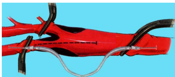
Рис. 1. Способ временного пункционного каротидного сосудистого шунтирования при выполнении каротидной эндартерэктомии после наложения сосудистых зажимов

После выделения каротидной бифуркации выполняется пункция иглой внутренней и общей сонных артерий с проведением металлического проводника через иглу и последующим проведением по проводнику катетеров 7F длиной 5 см в дистальный отдел внутренней сонной артерии и в проксимальный отдел общей сонной артерии.