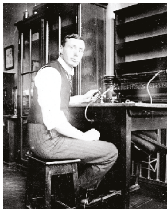
Рис. 1. Leonard Noon (1877–1913)

Рекомендуемый возраст начала АСИТ варьирует в разных странах от 3 до 5 лет [7, 20]. Эффективность АСИТ и польза для пациентов доказаны [24].